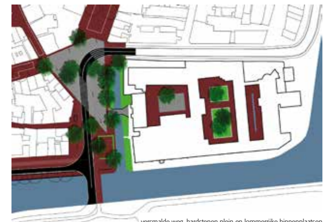
STAP 2 - SITUATIE

grasgroen XL-zebrapad met wegeverf en groene accenten