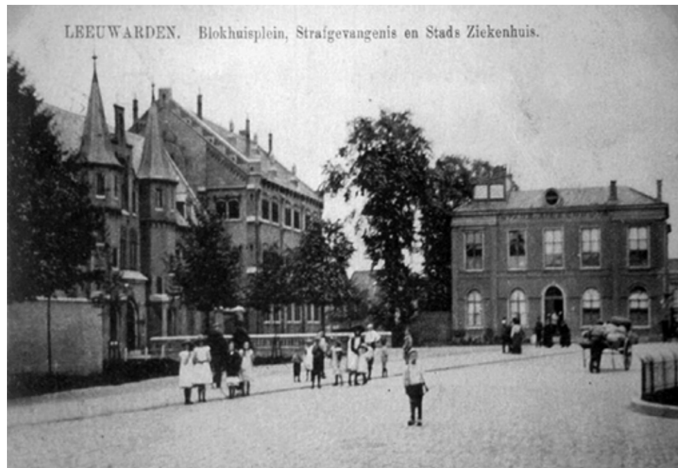
HISTORISCHE FOTO BLOKHUISPLEIN

versmalde weg, hardstenen plein en lommerrijke binnenplaatsen