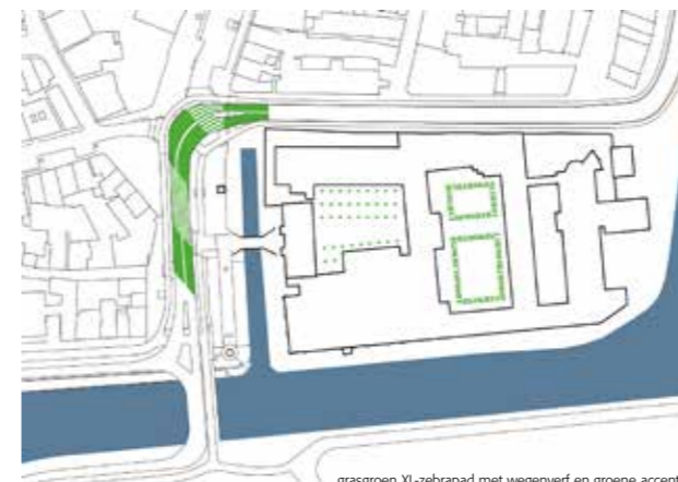
STAP 1 - SITUATIE

grasgroen XL-zebrapad met wegeverf en groene accenten