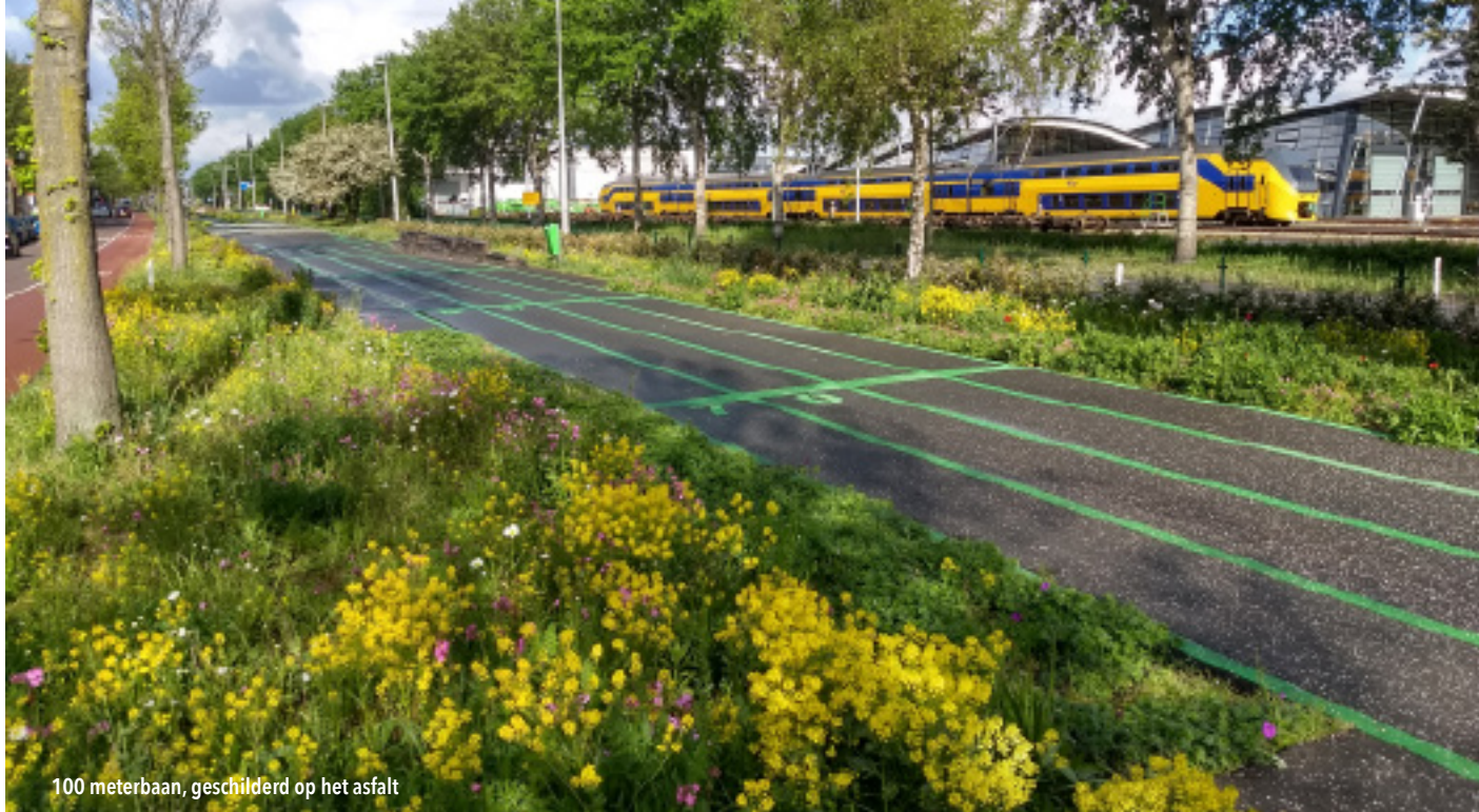
100 meterbaan, geschilderd op het asfalt