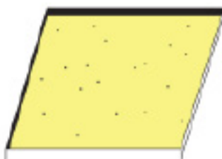
Optie 1: 0% asfalt Geen budget voor inrichting