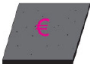
Beperkt budget 100% asfalt