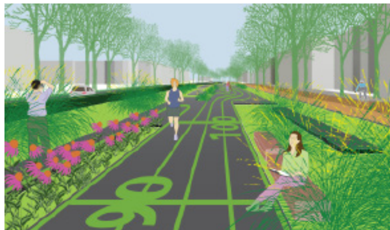
Impressie tijdelijke inrichting

behalen van een maximale ruimtelijke kwaliteit uit een, ten opzichte van de grote oppervlakte van het plangebied, zeer beperkt uitvoeringsbudget. Het afvoeren van al het asfalt uit de op te heffen rijweg zou het overgrote deel van het uitvoeringsbudget vergen. Door het asfalt grotendeels te handhaven komt budget vrij voor de tijdelijke inrichting van een levendige en groene esplanade. Er is gezocht naar minimale ingrepen die er zorg voor dragen dat de voormalige rijweg de uitstraling krijgt van een voetgangersgebied. Daarbij is ernaar gestreefd om de openbare ruimte ruimtelijk gezien een maximale