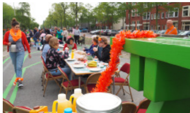
Ruimte voor buurt evenementen.

kunstmanifestatie. De nu ingevulde functies en gebruiksaanleidingen zijn bepaald in samenwerking met gemeente en wijkraad. Van een XXL-picknickbank en hooverboard-parcours tot een 100 meterbaan.