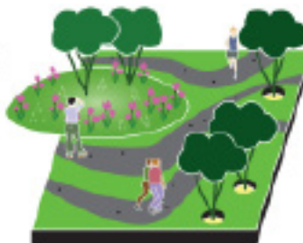
Optie 2: 90% asfalt Budget voor levendige openbare ruimte